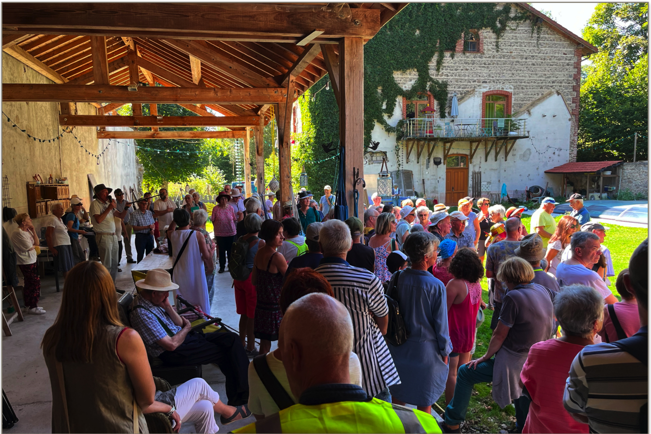
Le groupe a pu retrouver l'endroit exact où était bâtie l'usine (on voit encore les traces du toit en zigzag sur la maison), en s'abritant de la chaleur sous le préau fort utile.